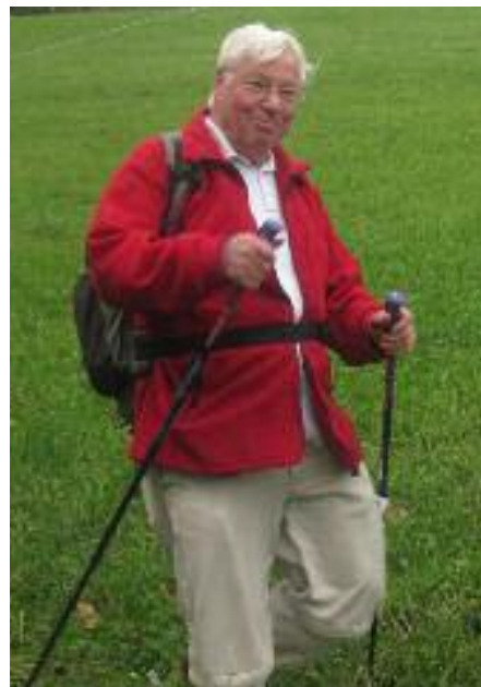
■ ... und bei einer Rucksackwanderung auf dem Hochrhörer im Jahr 2009