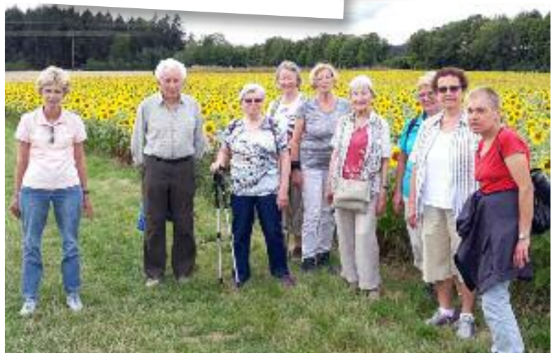
■ Besuch am Sonnenblumenfeld (19.8.20)