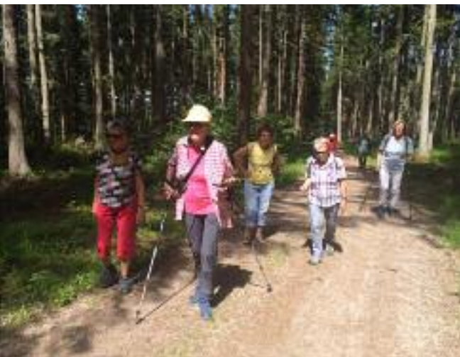
■ Erste Wanderung nach dem Lockdown im Juli

Erste Lockerungen gab es im Mai/Juni, daher standen wir im Vorstand im regelmäßigen Austausch, wann wir wieder mit dem Vereinsprogramm starten könnten. Aus der eigenen Vernunft heraus und insbesondere im Hinblick auf die Gesundheit unserer Mitglieder verzichteten wir zunächst weiter ganz auf Wanderungen.