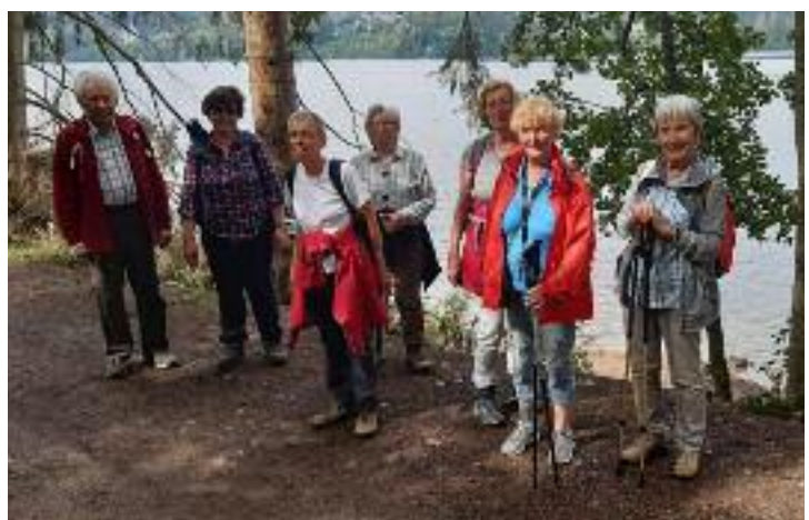
■ Unterwegs am Titisee (24.9.20)