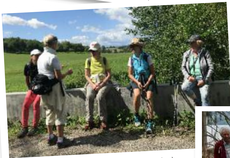
■ Brücke über den Jungbrunnenbach bei Rottweil (23.8.20)