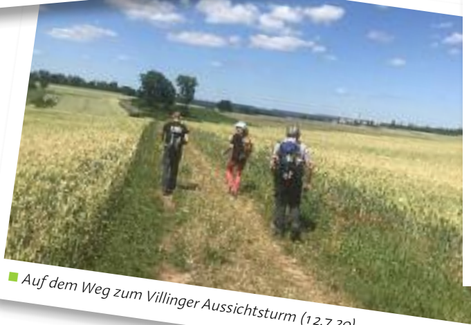
■ Auf dem Weg zum Villinger Aussichtsturm (12.7.20)