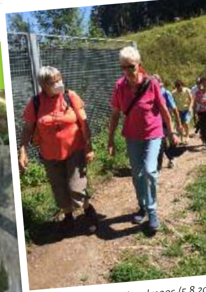
■ Beim Tunnel am Kugelmoos (5.8.20)