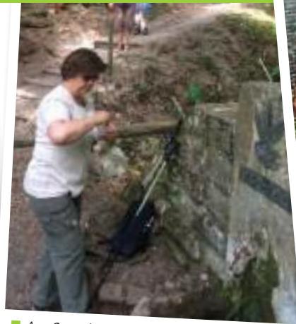
■ Am Setzebrünnele (8.7.20)