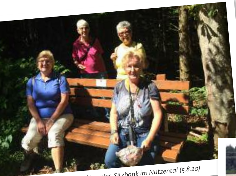
■ An der Schwarzwaldvereins-Sitzbank im Natzental (5.8.20)