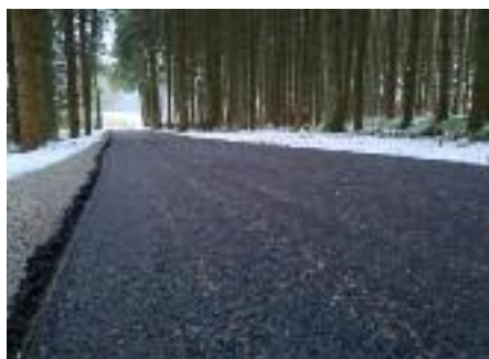
■ Klimaschutzprojekt Mooswald

2. Dass Entscheider der Kommune, aber auch in den zuständigen Ministerien nicht immer richtig entscheiden, zeigt uns aktuell das »Klimaschutzprojekt Radweg Mooswald« . Unter dem Deck-