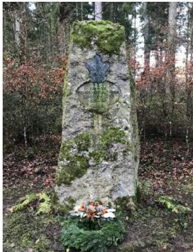
■ Der Gedenkstein im Natzental, aufgenommen am 24.11.2020

Seitdem finden sich alljährlich die Mitglieder nach einem kurzen Spaziergang am Ehrenmal ein, um der gefallenen und verstorbenen Mitglieder zu gedenken. Seit 1974 beteiligen sich auch die Villingen Wanderfreunde an dieser Feierstunde. Seit 1982 halten im Wechsel die Pfarrer der katholischen, der evangelischen und der evangelisch-methodistischen Kirche die Andacht, seit 1983 umrahmt ein Bläserquintett des Musikvereins Dauchingen die Feier. In den 70er- und 80er-Jahren beteiligten sich bis 150 Personen daran, in den letzten Jahren variiert die Zahl zwischen 30 und 50 Personen.