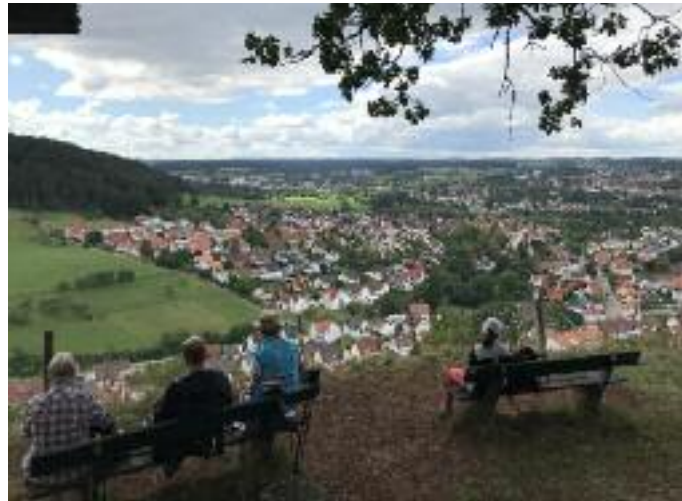
■ Wanderung zum Dissenhorn bei Rottweil am 23. August

Einfach eine kurze Mail an steffen.esslinger@gmx.net